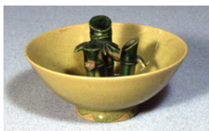
「十分盃」個人蔵 中央の突起部は竹を象る

十分盃とは、ある一定量を超えて酒を注ぎ入ると、中に入っていたすべての酒が下にこぼれ落ちてしまう仕掛けの盃である 1) 。盃の中央に突起があり、この突起の中側に盃の高さの八分目までの細管が通っている。細管は底部の穴と繋がっている構造で、