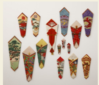
折熨斗各種 明治時代

そもそも「熨斗」とは進物に添えるものではなく、古来、高級な贈答食品であった干し鮑(アワビ)を薄く削ぎ、乾燥させ伸ばしたものを熨斗鮑(アワビ)それ自体を意味し、またその略称でもありました。今日、祝儀袋や進物の掛け紙に用いられる熨斗は、江戸時代以来の贈答のしきたりを簡略化した「折熨斗」であり、小さな方形の色紙を熨斗包みのかたちにしたもの、あるいはプリントされた味気ないものも少なくありません。しかし、折熨斗がもっとも多用された明治時代には、錦絵に劣らぬ彫りと摺りの木版技術を使い、目に楽しく色鮮やかなものが盛んに作られました。今展では、明治時代の貴重な木版摺りの折熨斗とその原紙をご紹介します。