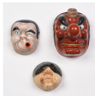
「可盃」白鷹禄水苑蔵 兵庫県西宮の酒造家・北辰馬家に 伝来したもの

可盃とは座興用の盃のことで、土佐(高知県)のお座敷遊びである。「可」の字は漢文で「可何々」(何々すべし)と書くように文章の上に付き下には来ない字であるため、下に置けない盃を「可盃」と呼ぶようになった。「おかめ」「ひよっこ」「天狗」の盃と「六角独楽」のセットで、コマの六面に各々盃の絵が描かれる。盃の大きさは、おかめ→ひよっこ→天狗の順に大きい。おかめは安定は悪いが下に置くことができ、ひよっこは口元に穴が開いているため、指で穴をふさぎながら飲み干さないと下に置くことはできない。天狗は、高い鼻が邪魔をして飲み干さないと下に置くことはできない。遊び方は、皆で円になりコマを回し、止まった時に軸の先が向いている人が、コマの絵柄の可盃で、一気に酒を飲み干す遊びである。