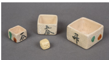
「遊興盃」白鷹水苑蔵 北辰馬家伝来

唄や踊りを披露する。該当する出目が出なければもう一度振るか、一回休みとして次の人に渡す。枱には「一升」や「五合」と描いてあるが、実際の容量はそれより少なく、一度に大量飲酒はしないのでご安心を。