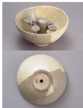
四谷一丁目遺跡出土の「十分盃」 新宿区蔵 上:中央の突起部は梅花を象る 下:底部を穿孔し液体が流れ出る仕組み